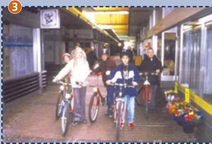
3 Ladenstraße im Olympischen Dorf: Radfahrer bitte absteigen! Achten Sie darauf, dass sich Ihr Kind nicht in den unterirdischen Fahrstraßen aufhält!