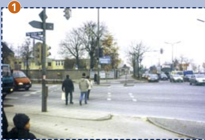
1 Straßenkreuzung Moosacher Straße/Lerchenauer Straße