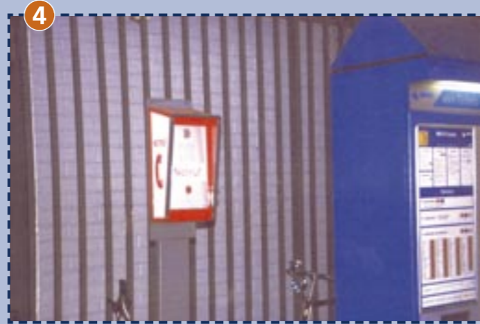
4 Notrufsäule im U-Bahnhof Olympiazentrum