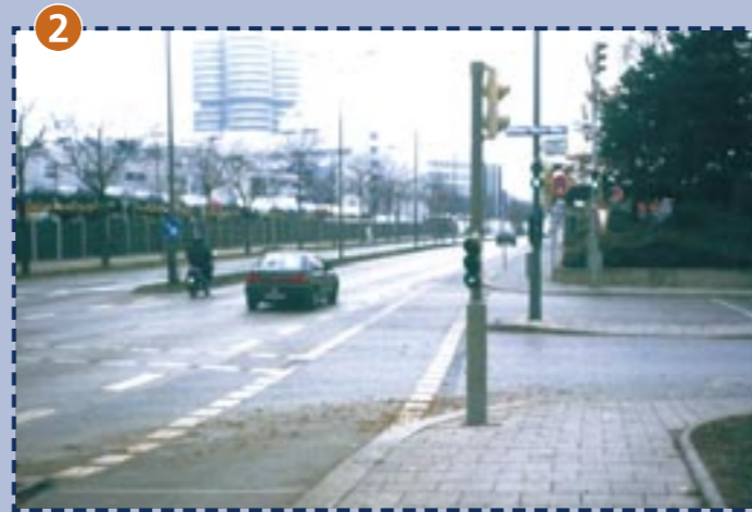
2 Einmündung Lerchenauer Straße/Helene-Mayer-Ring