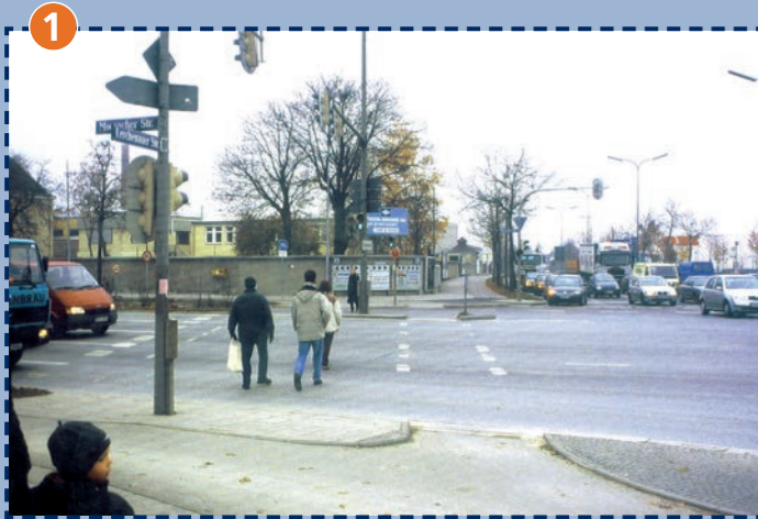
1 Straßenkreuzung Moosacher Straße/Lerchenauer Straße