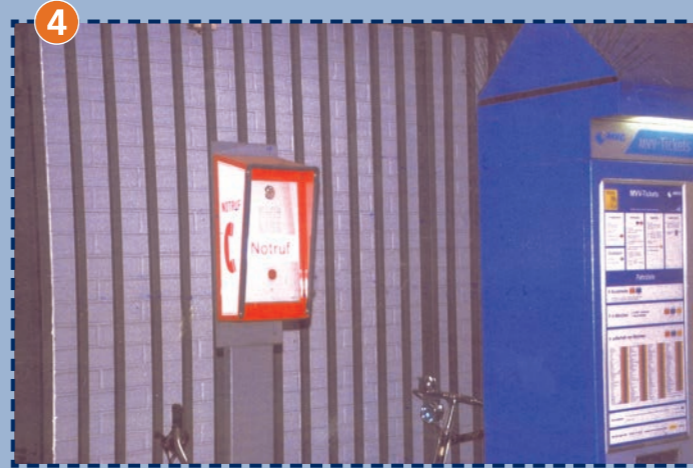
4 Notrufsäule im U-Bahnhof Olympiazentrum