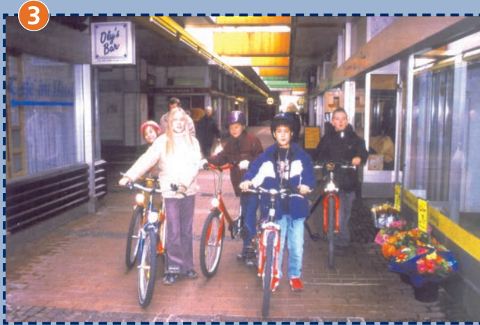
3 Ladenstraße im Olympischen Dorf: Radfahrer bitte absteigen! Achten Sie darauf, dass sich Ihr Kind nicht in den unterirdischen Fahrstraßen aufhält!