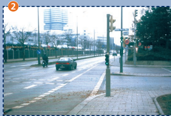
2 Einmündung Lerchenauer Straße/Helene-Mayer-Ring